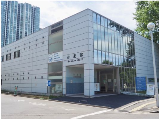
会場となる白鷹館の概観