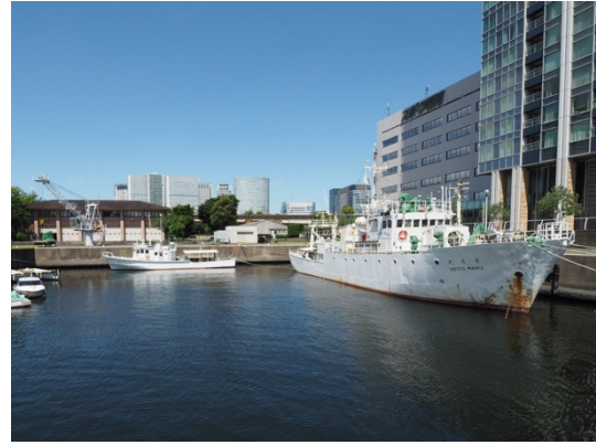
品川キャンパス内のポンドにつながる 練習船「青鷹丸」と「ひよどり」